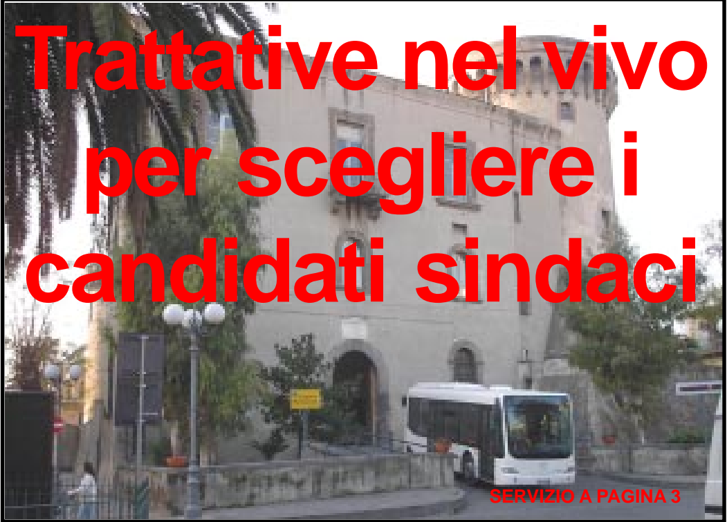
SERVIZIO A PAGINA 3

Vuoi ricevere il giornale in formato elettronico gratuitamente via e-mail? scrivi a free-press@libero.it e sarai subito accontentato